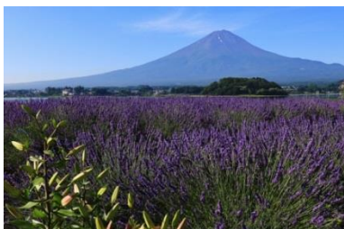
「富士山と初夏のラベンダー畑」